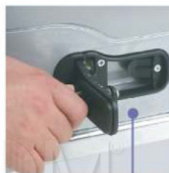
Praktyczny system wysprężania za pomocą klucza patentowego