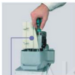
Możliwość regulacji wysokości napędu za pomocą czterech śrub